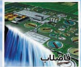
دستگاه های مناسب جهت استفاده در صنایع شیمیایی، معدنی و تصفیه فاضلاب